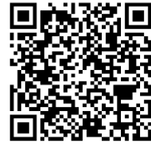
รายการลูกหนี้เงินยืม

ขอให้อำเภอทุกอำเภอตรวจสอบงบประมาณที่ได้รับจัดสรรในไตรมาส ๓ ว่ามีส่วนได้ที่ยังไม่ได้ทำการเบิกจ่าย ขอให้เร่งรัดการเบิกจ่ายในส่วนงบประมาณที่เหลือด้วย มติที่ประชุม รับทราบ