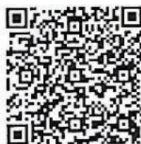
ข้อกำหนดจรรยาบรรณข้าราชการ กรมการพัฒนาชุมชน พ.ศ.๒๕๖๔

กรมการพัฒนาชุมชน ได้ดำเนินการประมวลความคิดเห็นและข้อเสนอแนะต่อร่างข้อกำหนดจรรยาบรรณข้าราชการกรมการพัฒนาชุมชน พ.ศ.๒๕๖๔ และจัดทำข้อกำหนดจรรยาบรรณข้าราชการกรมการพัฒนาชุมชน พ.ศ.๒๕๖๔ เพื่อให้บุคลากรในสังกัดใช้เป็นหลักเกณฑ์ในการปฏิบัติตน และรักษาคุณงามความดีที่ต้องยึดถือในการปฏิบัติงาน เพื่อสร้างการรับรู้ข้อกำหนดจรรยาบรรณข้าราชการกรมการพัฒนาชุมชน พ.ศ.๒๕๖๔ เป็นไปด้วยความเรียบร้อย เกิดประสิทธิภาพและประสิทธิผล จึงขอให้สำนักงานพัฒนาชุมชนจังหวัด/อำเภอดำเนินการเผยแพร่และประชาสัมพันธ์ข้อกำหนดจรรยาบรรณข้าราชการกรมการพัฒนาชุมชน พ.ศ.๒๕๖๔ และอินโฟกราฟิกส์ (Infographic) ข้อกำหนดจรรยาบรรณข้าราชการกรมการพัฒนาชุมชน พ.ศ.๒๕๖๔ ให้บุคลากรในสังกัดทุกระดับได้รับทราบและถือปฏิบัติ พร้อมทั้งลงนามรับทราบข้อกำหนดจรรยาบรรณข้าราชการกรมการพัฒนาชุมชน พ.ศ.๒๕๖๔ ส่งให้จังหวัดภายในวันที่ ๑๑ กันยายน ๒๕๖๔ เพื่อรวบรวมรายงานกรมการพัฒนาชุมชนทราบต่อไป รายละเอียดสามารถดาวน์โหลดได้ที่เว็บไซต์กลุ่มงานคุ้มครองจรรยาบรรณข้าราชการกรมการพัฒนาชุมชน http://ethic.cdd.go.th หรือ QR Code